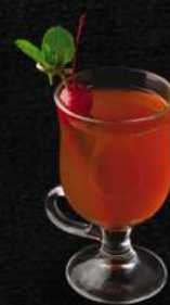
"Гендольф" з бренді, 250 мл 120.-