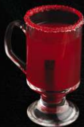
Малиновий "Грог" з ромом, 250 мл 120.-