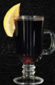
"Глінтвейн" класичний, 250 мл 120.-