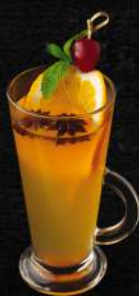
Білий "Глінтвейн" зі смаком бузини, 250 мл 120.-