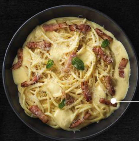
Карбонара, 300 г