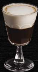
Irish кова, 250 мл 120.-